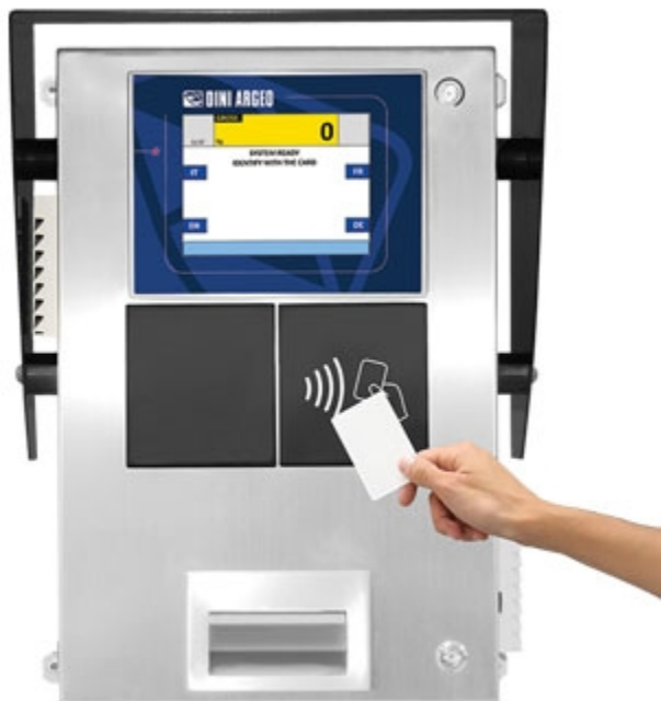
3590EGTBOX8: con lettore tessere RFID.