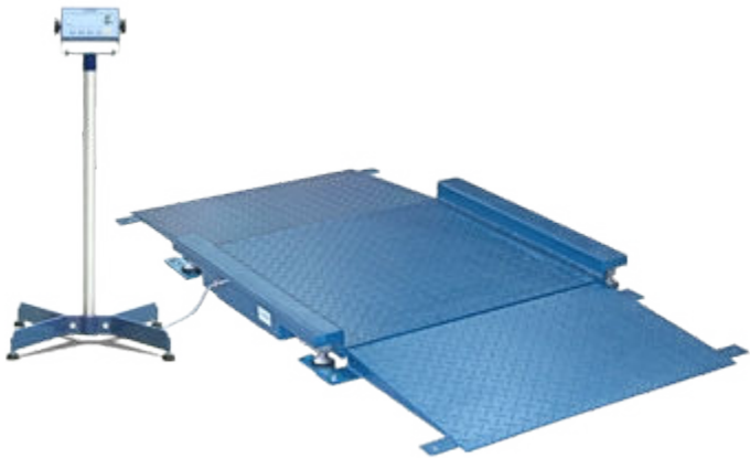
Esempio di installazione con indicatore DFWL e colonna CSP38